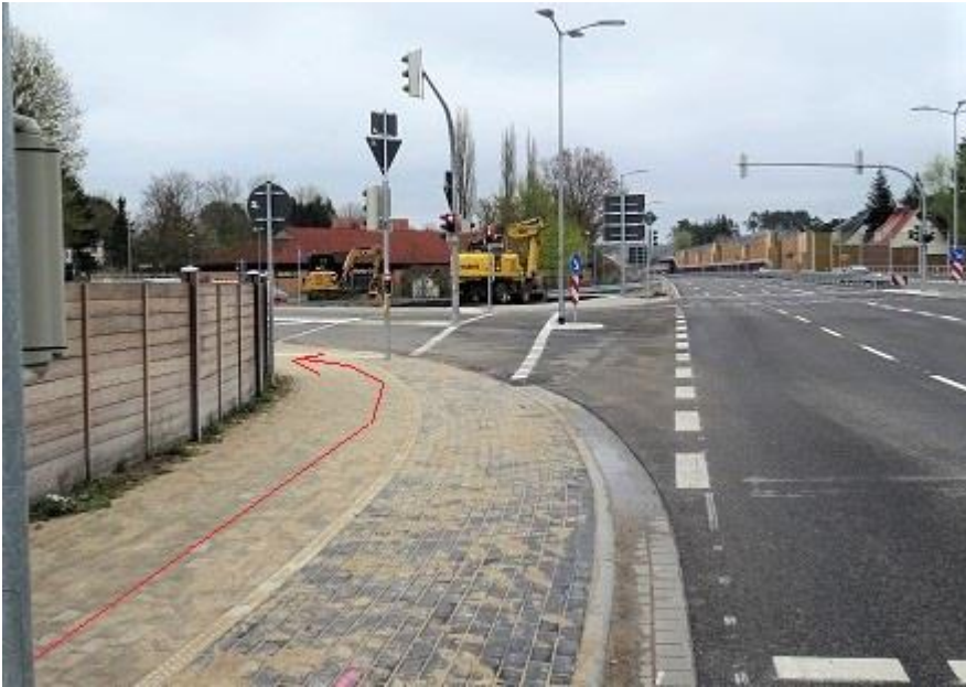
B 321 Geh- / Radweg