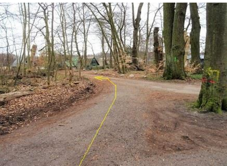
Linksabbiegung zum Uferweg