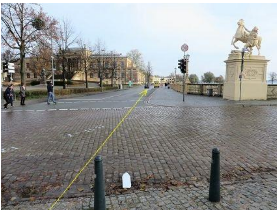
Querung Schlosstraße zur Werderstraße