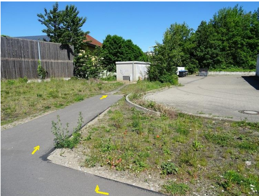
B 321 - Einbiegung auf Weg zum Wohnpark