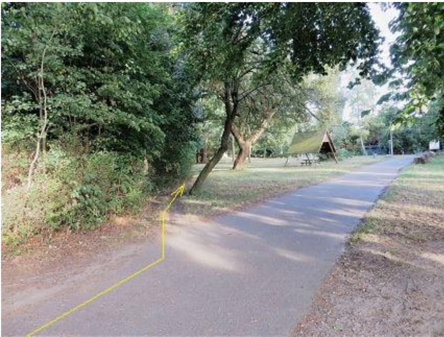
„Schleifmühlenweg“ - Fauler See

Anfang Rastplatz-Dreieck (Nähe Zoo-Gaststätte)