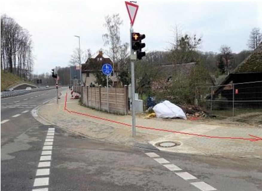
Einbiegung von B 321 in Alte Critzer Landstraße