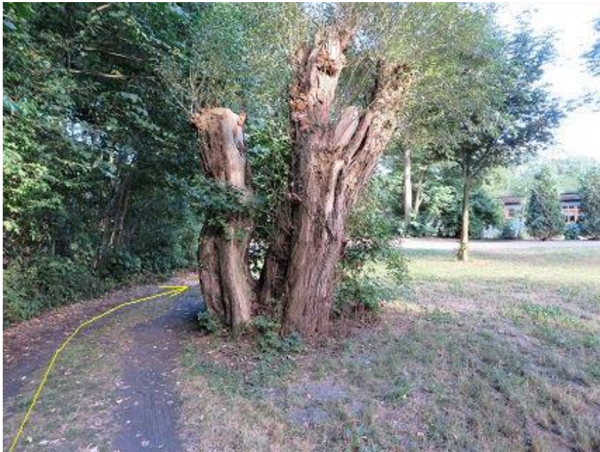
Rastplatz-Dreieck bei Zoogaststätte