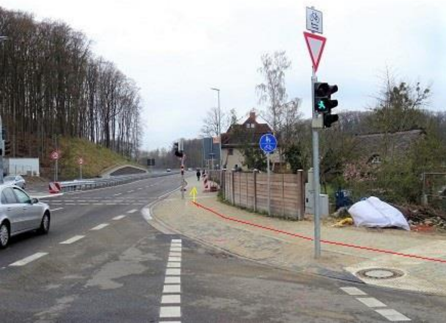
Einbiegung von Alte Crivitzer Landstraße auf Gehweg B 321