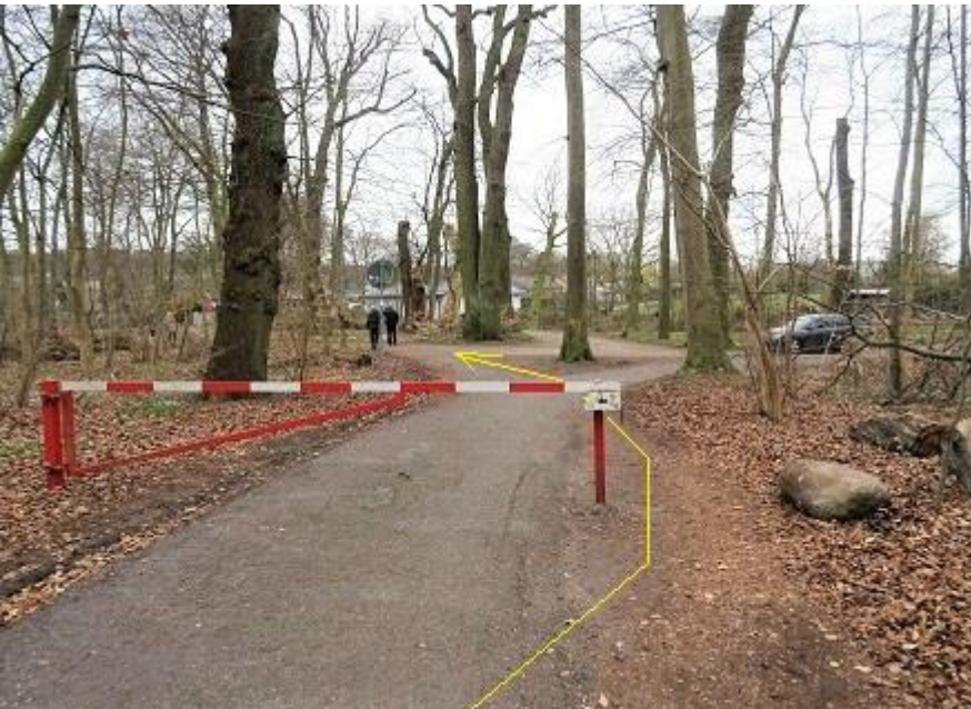
Burg - Asphaltweg