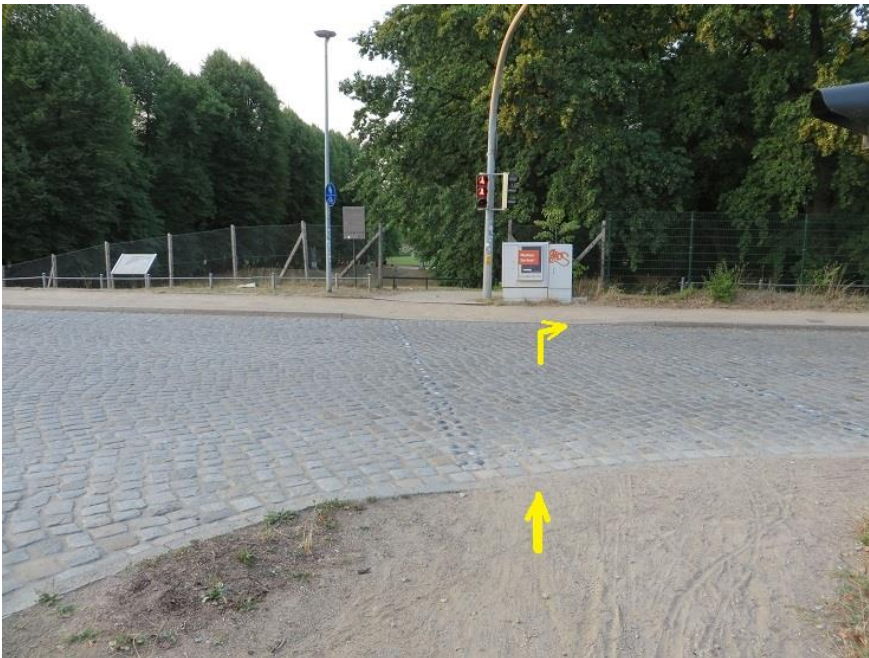
Johannes-Stelling- Straße -

Querung Schleifmühlenweg - Höhe Eingang Freilichtbühne