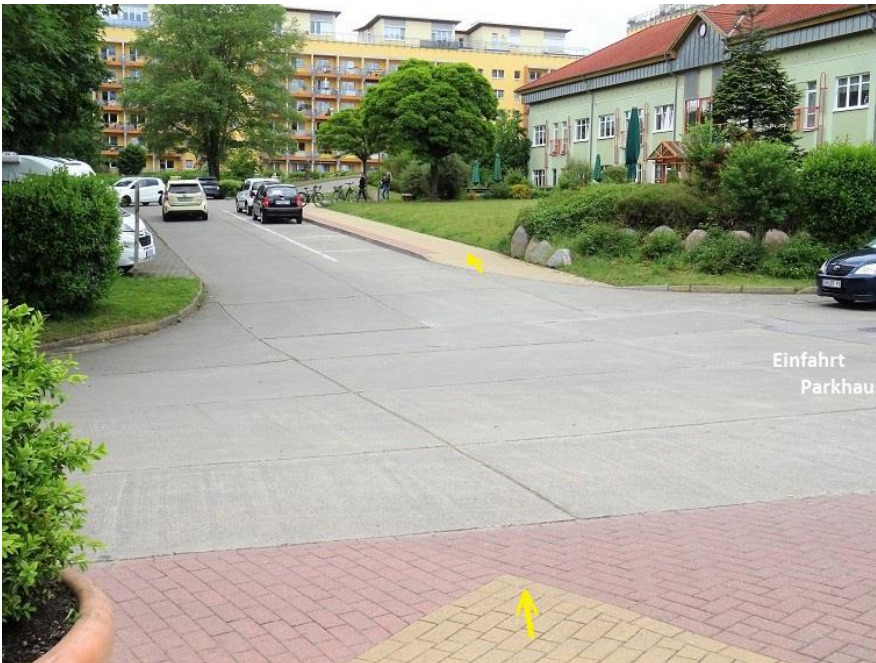
Wohnpark Zippendorf -