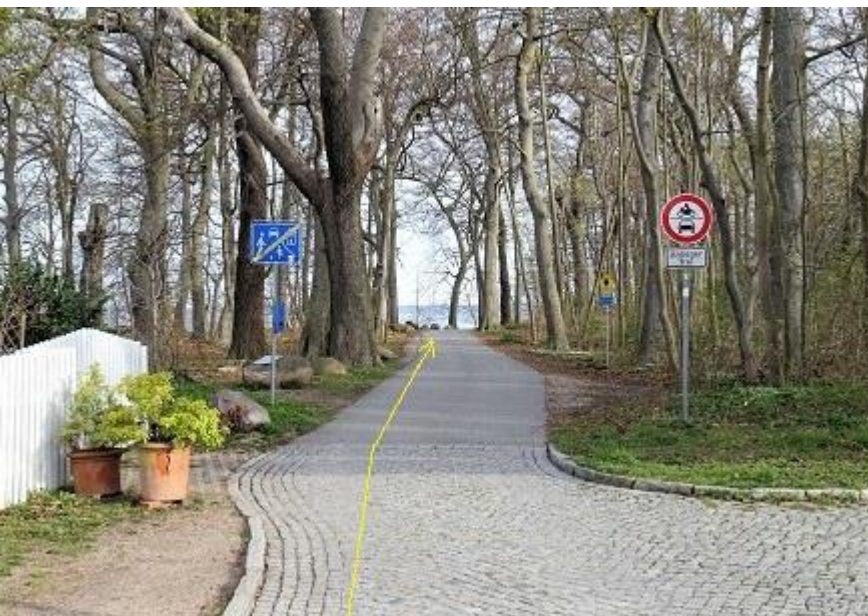
„Am Strand“ -