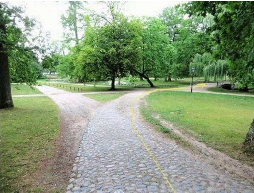
Schlossgarten – Pflasterweg zum Kreuzkanal