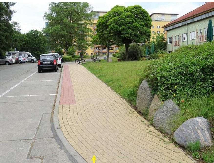
Gehweg -> Haus Nr. 35 - 43