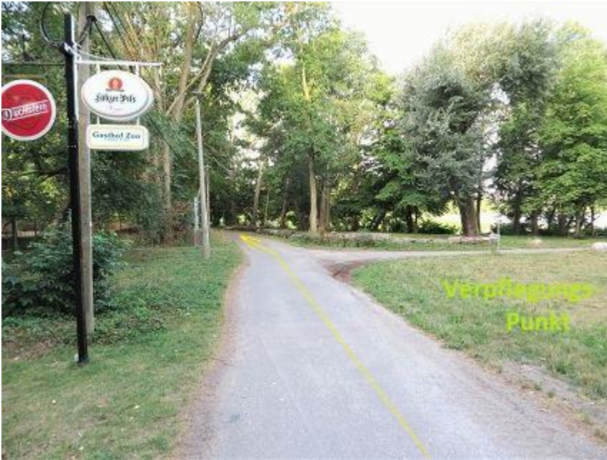
„Gasthof Zoo“ am Hexenberg