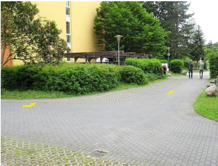
Einbiegung auf Räthenweg