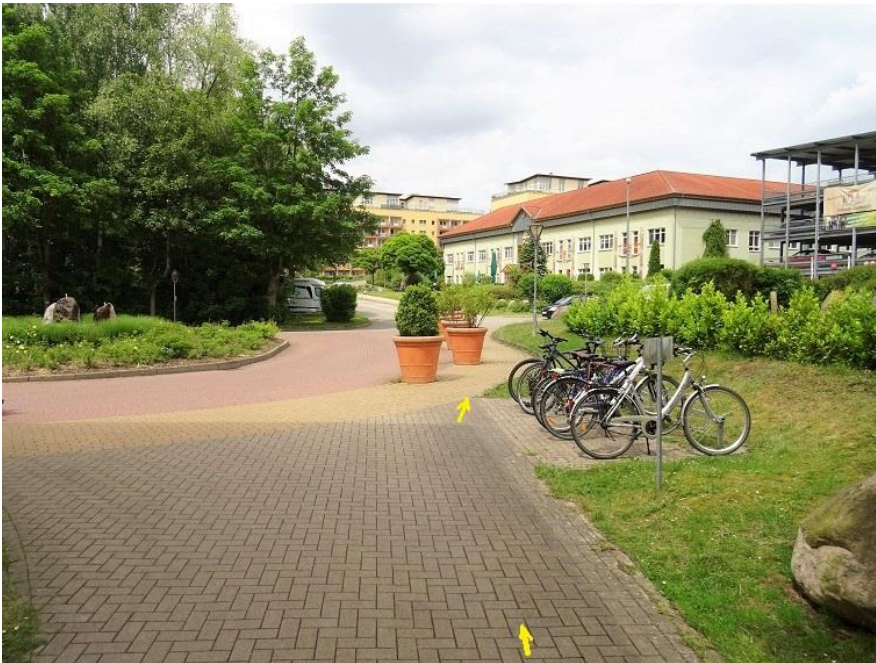
Wendekreis vor Eingangsbereich Haus 3