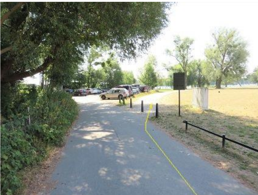
Abbiegung vor Seglerheim zur Marstallhalbinsel-Passage