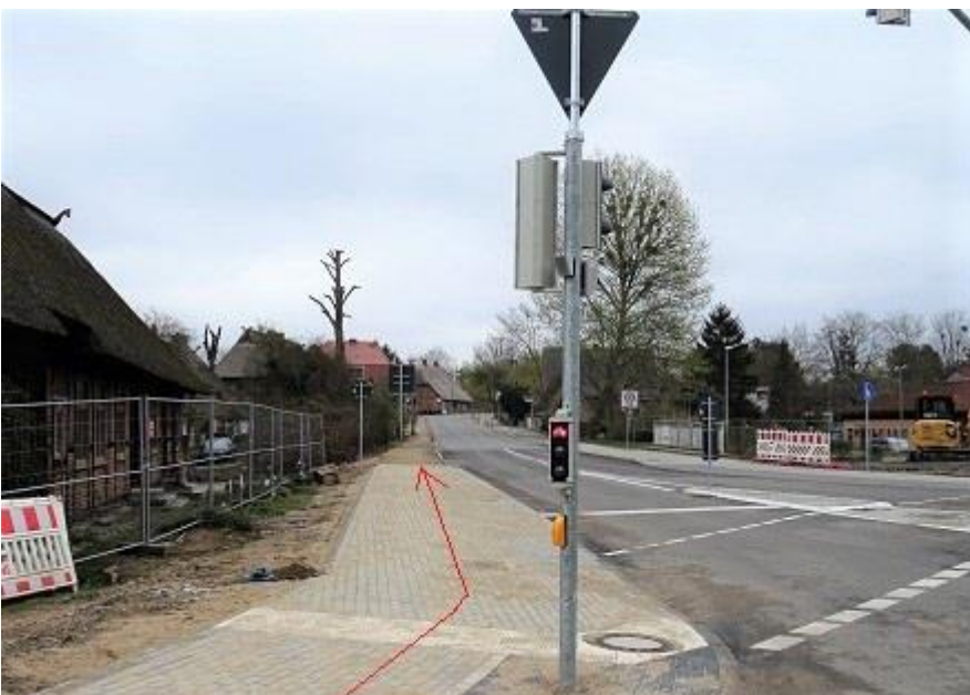
Alte Crivitzer Landstraße -