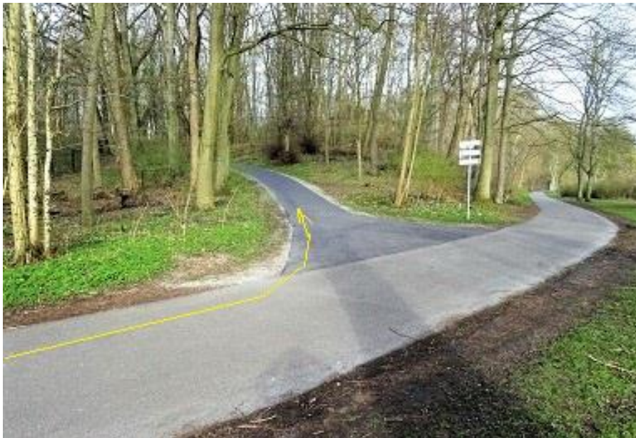
Franzosenweg - nach links - Hexenberg hoch MP 15,40 km