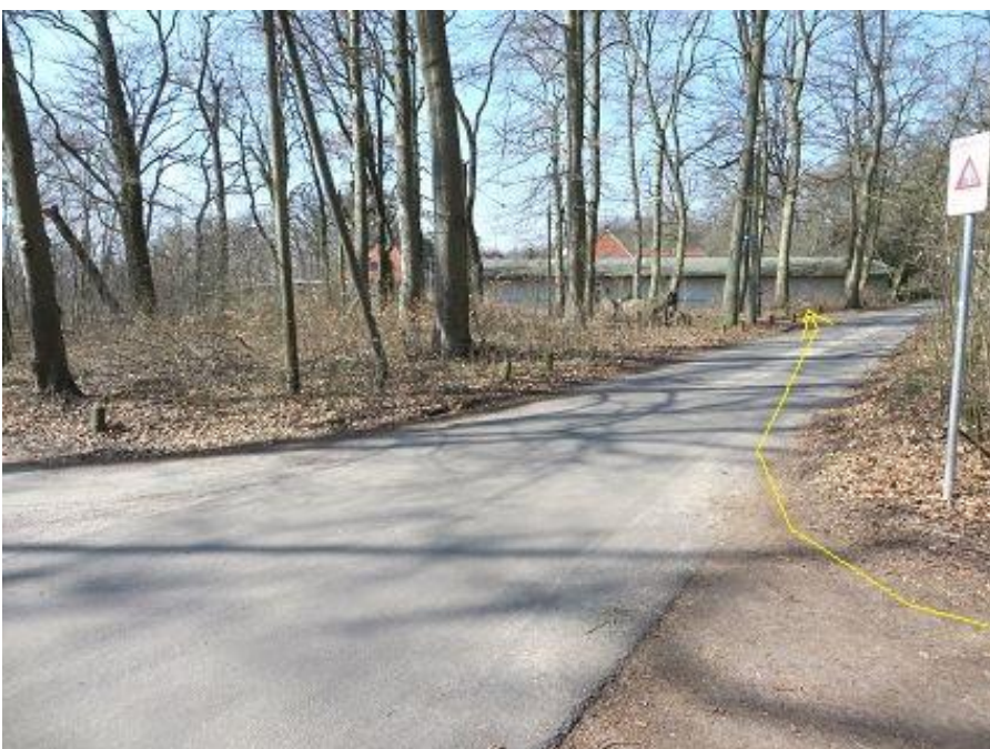
Anfang Waldschulweg - auf Höhe alter Zooeingang u. Jugendherberge MP 15,61 km