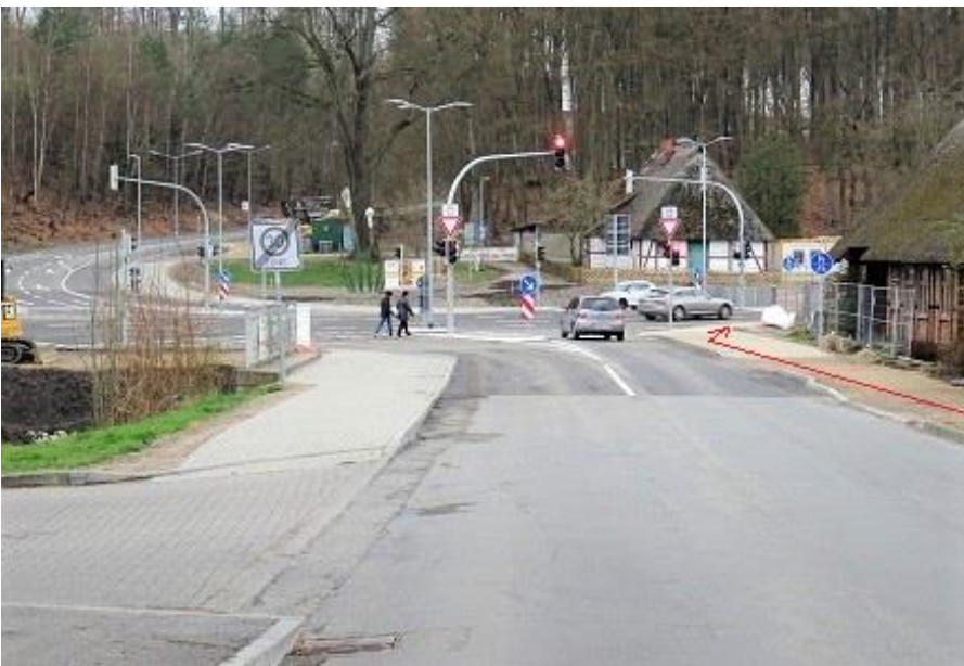
Alte Crivitzer Landstraße - Höhe Netto