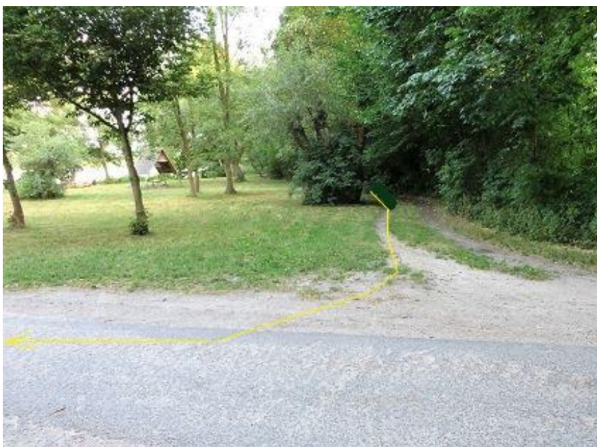
Einbiegung auf „Hexenberg“