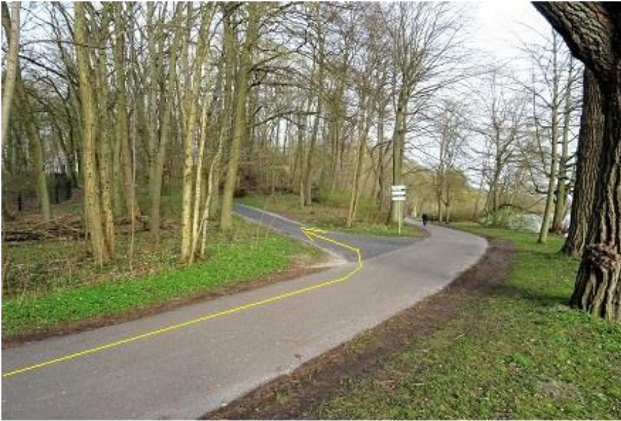
Franzosenweg - Linkseinbiegung zum Hexenberg