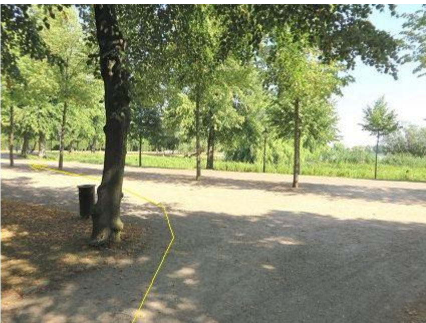
Ende Birkenweg Einbiegung auf Lennéstraße