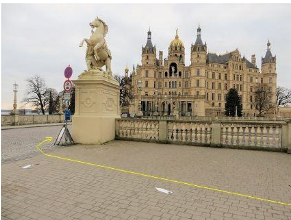
Brücke zur Schlossinsel