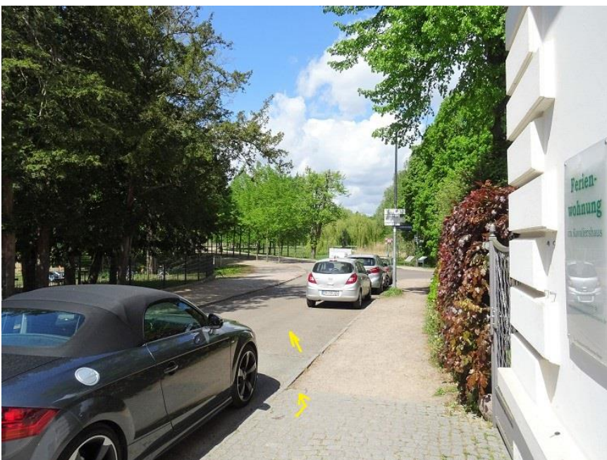
Anfang Schlossgarten Lennéstraße

Auf Höhe Ende Kavaliershaus Querung der Fahrbahn